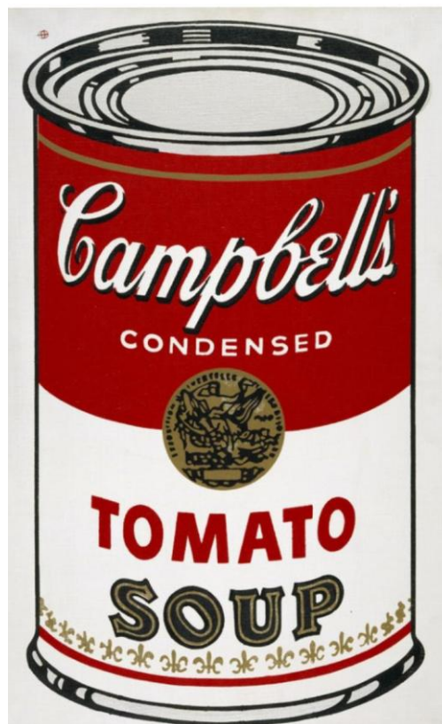
Lata de Sopa Campbell's (1962), Andy Warhol

QUESTÃO 40 – A imagem abaixo é uma reprodução da obra "Lata de Sopa Campbell's ", criada na década de 1960 pelo artista Andy Warhol como parte de uma série de 32 telas representando latas da sopa Campbell's .