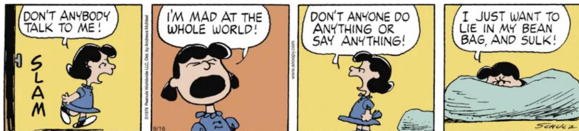
Available at: https://www.gocomics.com/peanuts/2025/09/16

Which of the following would be considered the opposite of sulk?