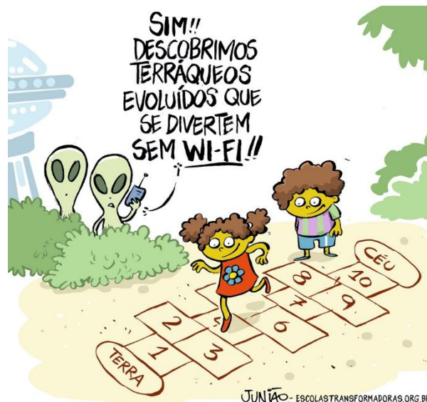
JUNIÃO. Escolas transformadoras . Disponível em < https://juniao.com.br/chargecartum/ >.

Na fala do personagem da charge acima, o termo “sem wi-fi” é um termo que: