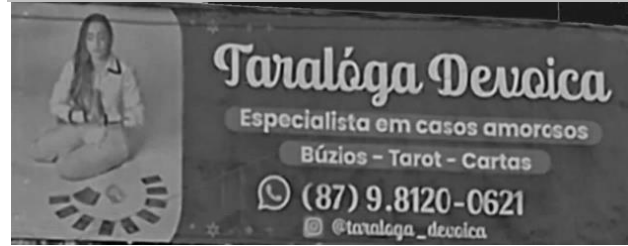
Fotografado no dia 16.08.2025

Na imagem do painel publicitário acima, há um desvio da norma culta no que se refere à: