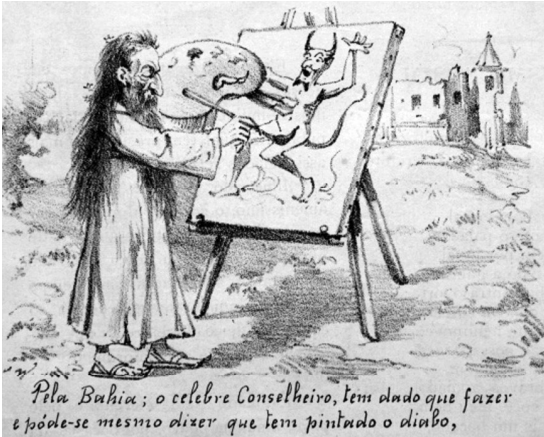
Revista Ilustrada, 1897.

23. Motivados por pressões sociais, fanatismos religiosos e interesses políticos, diversos movimentos messiânicos ocorreram durante a Primeira República no Brasil (1889–1930). Alguns desses movimentos assumiram um caráter autônomo e combativo, enquanto outros assumiram sua face dependente e conciliadora.