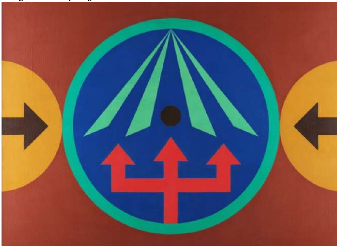
Rubem Valentim, Emblemático 78, 1978. 75,7 cm X 103 cm

Considere a imagem e o texto que seguem: