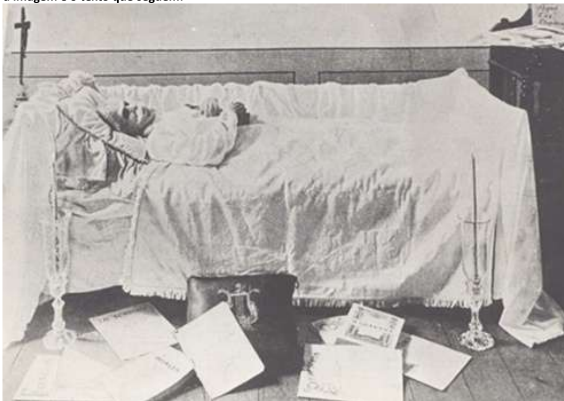
Carlos Gomes no leito de morte em Belém

Considere a imagem e o texto que seguem: