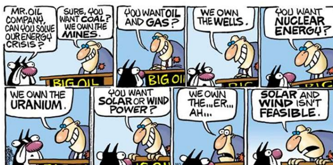
Mother Goose and Grimm cartoon, by Mike Peters

O texto seguinte servirá de base para responder às questões de 17 a 20.