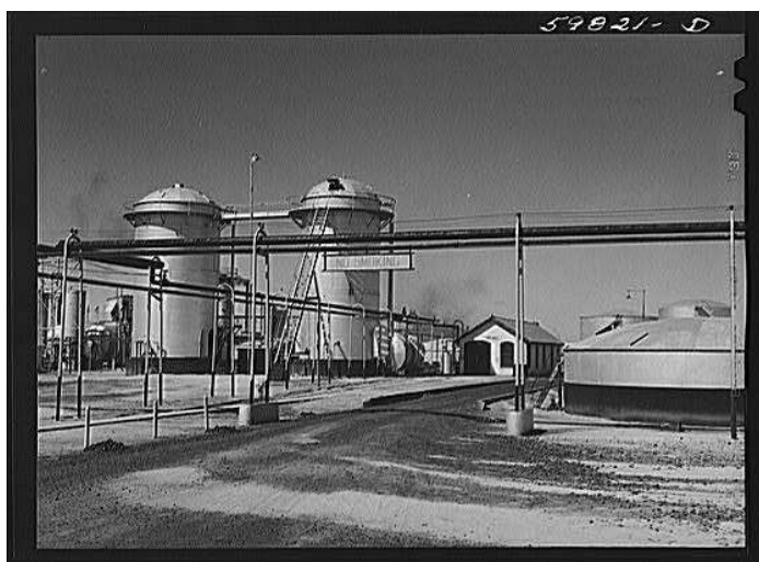
Wolcott, Marion Post. Barnsdall oil refinery. Kansas, 1941.

While refining is a complex process, the goal is straightforward: to take crude oil, which is virtually unusable in its natural state, and transform it into petroleum products used for a variety of purposes such as heating homes, fueling vehicles and making petrochemical plastics.