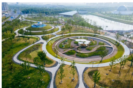
O maior parque-esponja de Shanghai: “Céu estrelado”

O conceito de cidade-esponja, criado pelo arquiteto chinês Kongjian Yu, baseia-se no uso de infraestrutura verde-azul para ampliar a permeabilidade urbana e mitigar enchentes.