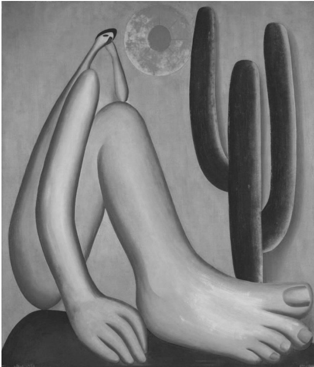
Tarsila do Amaral. Abaporu . Internet: https://www.moma.org .

A obra Abaporu , reproduzida na imagem precedente, é um ícone do