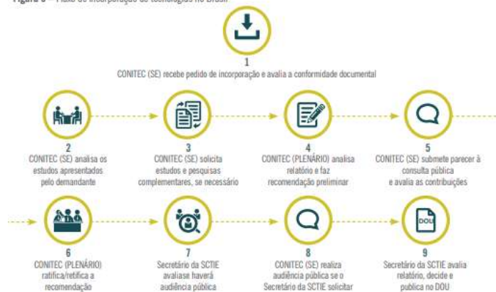
Figura 3 – Fluxo de incorporação de tecnologias no Brasil

O texto seguinte servirá de base para responder à questão 26.