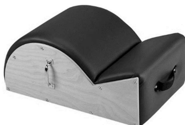
Figura 1: ilustrativa e sem escalas

Um estúdio de pilates está reformando seus equipamentos e irá substituir o tecido que reveste o aparelho step barrel (Figura 1). O diagrama (Figura 2) representa a vista lateral deste equipamento informando suas dimensões, em que a base possui 120 cm, a altura lateral direita mede 50 cm, e a medida do segmento que une a lateral até o trecho semicircular mede 30 cm.