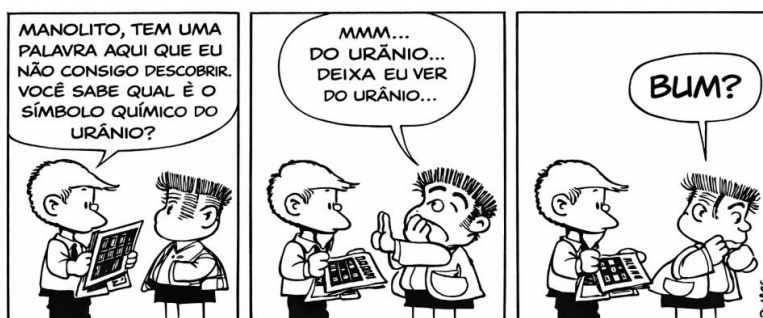
QUINO. 10 anos com Mafalda. Tradução de Monica Stahel. São Paulo: Editora Martins Fontes, 2010. (Adaptada)

Com base na leitura dos Textos I e II e em seus próprios conhecimentos sobre a temática, redija um texto dissertativo-argumentativo de, no mínimo 15 (quinze) linhas e, no máximo, 30 (trinta) linhas, sobre o tema: