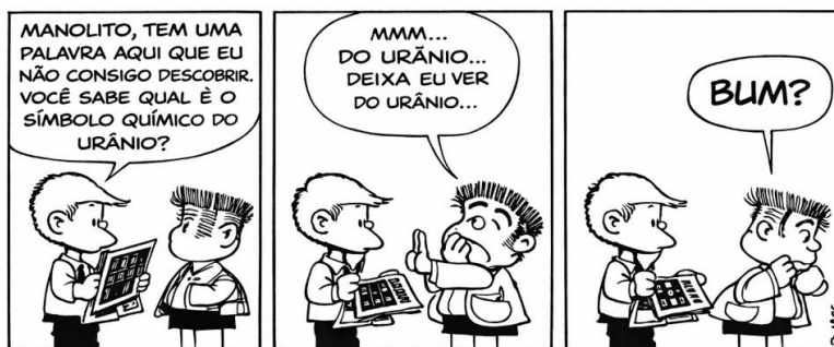
QUINO. 10 anos com Mafalda. Tradução de Monica Stahel. São Paulo: Editora Martins Fontes, 2010. (Adaptada)

Com base na leitura dos Textos I e II e em seus próprios conhecimentos sobre a temática, redija um texto dissertativo-argumentativo de, no mínimo 15 (quinze) linhas e, no máximo, 30 (trinta) linhas, sobre o tema: