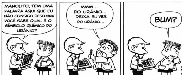
QUINO. 10 anos com Mafalda. Tradução de Monica Stahel. São Paulo: Editora Martins Fontes, 2010. (Adaptada)

Com base na leitura dos Textos I e II e em seus próprios conhecimentos sobre a temática, redija um texto dissertativo-argumentativo de, no mínimo 15 (quinze) linhas e, no máximo, 30 (trinta) linhas, sobre o tema: