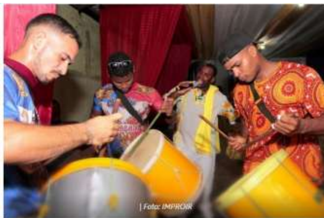
Encontros de valorização cultural ocorreram dentro dos Ciclos do Marabaixo | Foto: IMPROIR

Disponível em: macapa.ap.gov.br . Acesso em: 18 dez. 2025.