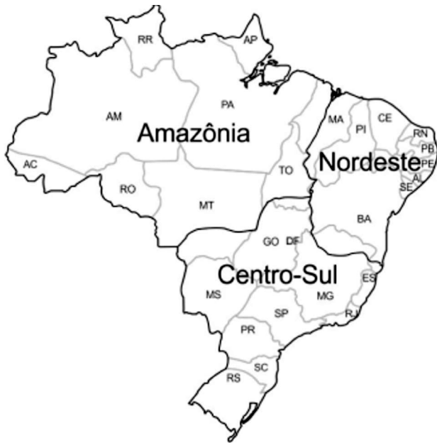
Figura 01 – Os complexos regionais brasileiros

(CALDINI, V. & ÍSOLA, L. Atlas Geográfico Saraiva . São Paulo: Saraiva, 2009. p.73)