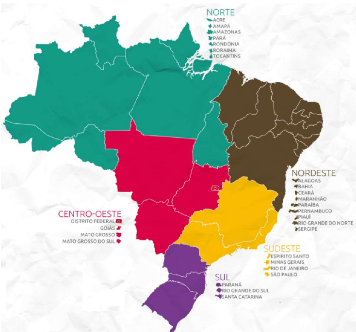
Figura 02 – Divisão regional do IBGE