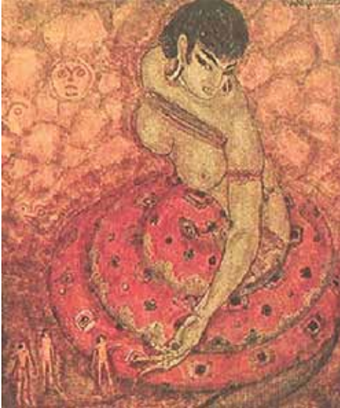
(A Cobra Grande Manda para Sua Filha a Noz de Tucumã, 1921. Disponível em: https://enciclopedia.itaucultural.org.br/obras/82367-a-cobra-grande-manda-para-sua-filha-a-noz-de-tucuma )

Essa obra foi produzida por um artista participante da Semana de 1922, não pertencente ao grupo paulista, mas que, mesmo antes do período, já realizava pesquisas plásticas integrando elementos da linguagem marajoara às suas pinturas e ilustrações associadas à Escola de Paris.