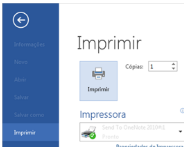
Figura 1 https://support.microsoft.com/pt-br

A tela a seguir demonstra algumas opções do módulo de impressão do Microsoft Word. O campo “Cópias” tem a função de: