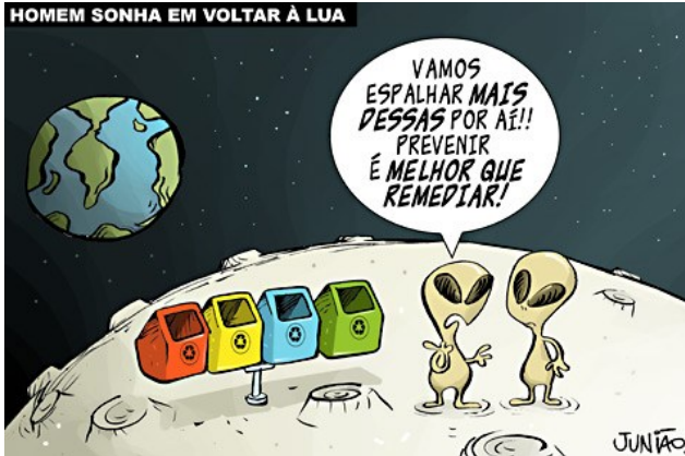
JUNIÃO. Homem sonha em voltar à lua. Disponível em < https://juniao.com.br/chargecartum/ >.

Reescrevendo o trecho da charge acima: “Prevenir é melhor que remediar”, assinale a alternativa que se apresenta correta, sem alterar o significado básico original.