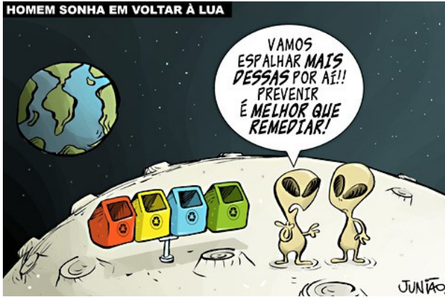
JUNIÃO. Homem sonha em voltar à lua. Disponível em < https://juniao.com.br/chargecartum/ >.

Reescrevendo o trecho da charge acima: “Prevenir é melhor que remediar”, assinale a alternativa que se apresenta correta, sem alterar o significado básico original.