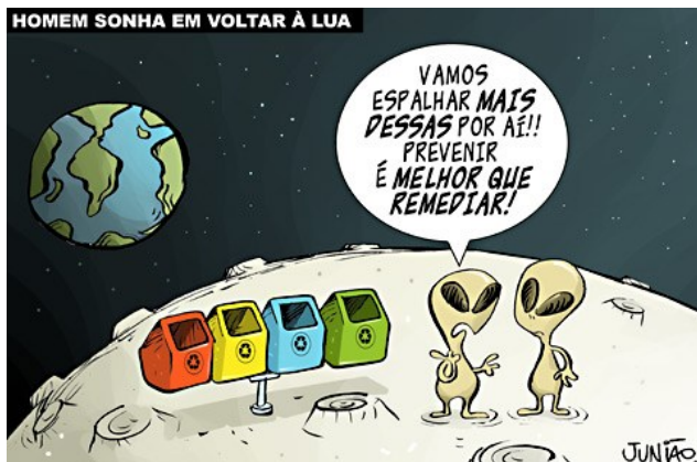
JUNIÃO. Homem sonha em voltar à lua. Disponível em < https://juniao.com.br/chargecartum/ >.

Reescrevendo o trecho da charge acima: “Prevenir é melhor que remediar”, assinale a alternativa que se apresenta correta, sem alterar o significado básico original.