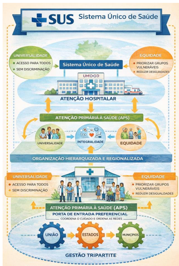
Imagem 01: Esquema do Sistema Único de Saúde representando a organização hierarquizada e regionalizada da atenção à saúde, com a Atenção Primária à Saúde (APS) como porta de entrada preferencial, articulada à Atenção Especializada e Hospitalar, destacando os princípios da universalidade, integralidade e equidade, bem como a gestão tripartite entre União, Estados e Municípios.

Durante uma reunião de planejamento em uma Unidade Básica de Saúde, o enfermeiro da Estratégia Saúde da Família analisa o fluxo assistencial de usuários com condições crônicas, observando dificuldades de acesso à atenção especializada, duplicidade de encaminhamentos e fragilidades na contrarreferência. A partir da análise do esquema organizativo do SUS apresentado na imagem 01 e dos fundamentos legais do sistema, o enfermeiro propõe ações para reorganizar o cuidado e qualificar a atenção prestada à população adscrita.