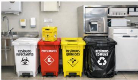
Imagem 01: Exemplo de descarte de resíduos em ambiente hospitalar.

No âmbito da atuação do profissional farmacêutico, especialmente em farmácias hospitalares, unidades básicas de saúde, serviços de oncologia e centrais de abastecimento farmacêutico, o conhecimento do Regulamento Técnico para o Gerenciamento de Resíduos de Serviços de Saúde (RSS), conforme a RDC ANVISA nº 222/2018, é fundamental para a segurança do paciente, dos trabalhadores e do meio ambiente.