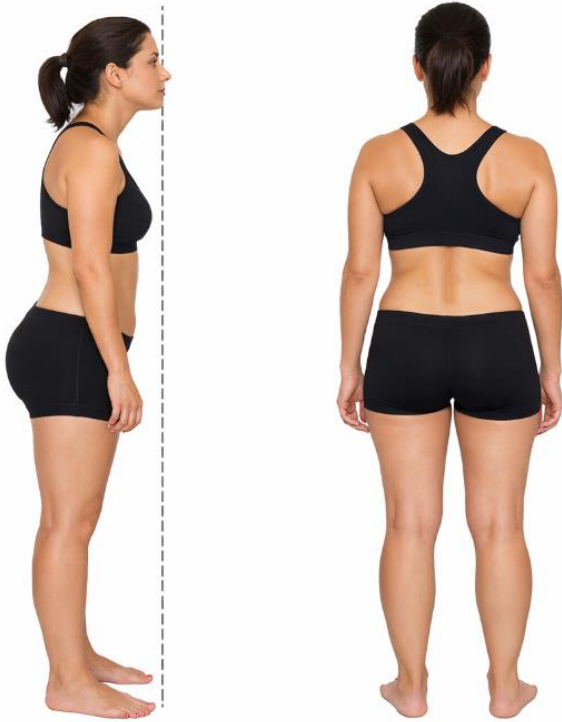
Imagem 01: Avaliação postural de desalinhamentos corporais.

A imagem 01 apresentada abaixo representa uma avaliação postural realizada em ortostatismo, contemplando as vistas lateral e posterior de um paciente adulto durante exame físico fisioterapêutico. Na análise do plano sagital, observa-se anteriorização da cabeça, acentuação da cifose torácica e hiperlordose lombar de caráter compensatório, associada à anteversão pélvica, indicando alterações no alinhamento global do corpo e no posicionamento do centro de gravidade.