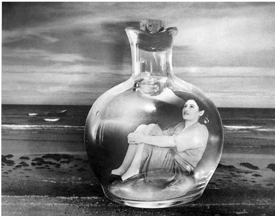
STERN, Grete. Botella del mar. Sueño N° 5 . 1950. Museu de Arte Latinoamericano de Buenos Aires (MALBA), Buenos Aires. Adaptado.

A imagem apresentada refere-se à Arte Moderna produzida na América Latina no século XX. Grete Stern, artista alemã radicada na Argentina, realizou, na década de 1940, a mais extensa série fotográfica de sua obra: “Os sonhos”. Os trabalhos para essa série consistiam em interpretações gráficas de depoimentos de sonhos enviados por leitoras da época à revista Idilio .