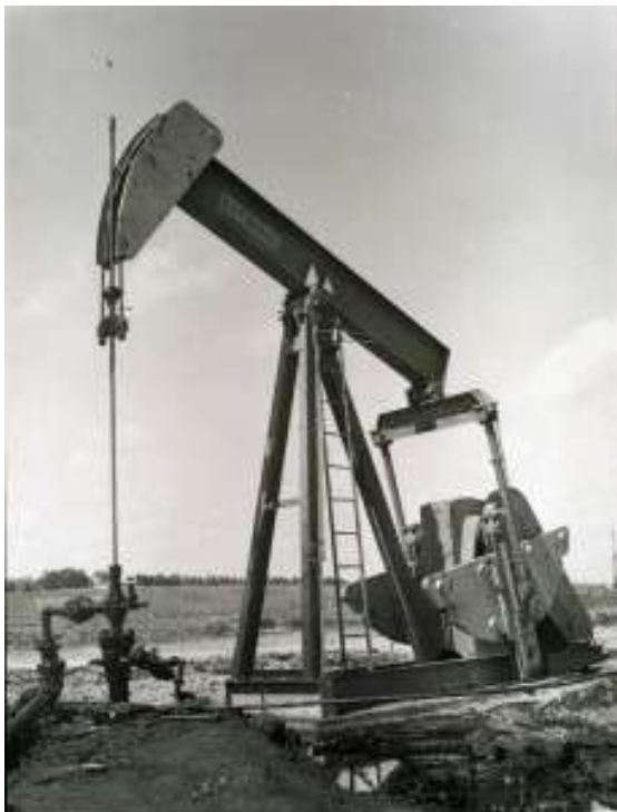
Perfuração em Carmópolis.