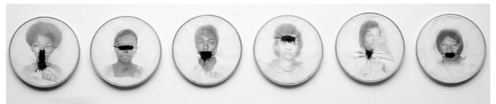
Rosana Paulino. Bastidores . 1997.

A obra Bastidores , da artista Rosana Paulino, é composta por um conjunto de seis fotografias de mulheres negras, reproduzidas sobre tecido e presas em arcos de madeira em formato redondo, algo típico das obras renascentistas. Nessa obra, a artista