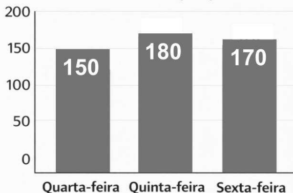
Visitantes em uma exposição de arte

A coordenação de um centro cultural divulgou, em um relatório ilustrado por gráfico de barras, o número de visitantes que compareceram a uma exposição de arte ao longo de três dias consecutivos.