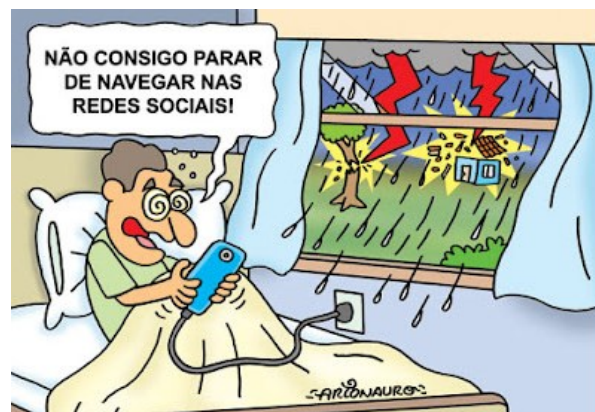
ARIONAURO. Celular vício redes sociais . Disponível em < http://www.arionaurocartuns.com.br/2021/02/charge-celular-vicio-redes-sociais.html >.

A expressão “Não consigo parar de navegar”, utilizada na charge acima, indica uma ação: