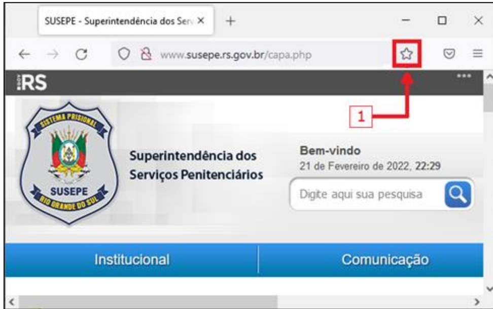
Figura 2 – Janela principal do navegador Mozilla Firefox

QUESTÃO 29 – A Figura 2 abaixo apresenta a janela principal do navegador Mozilla Firefox. Na Figura, está destacado um ícone da barra de ferramentas: