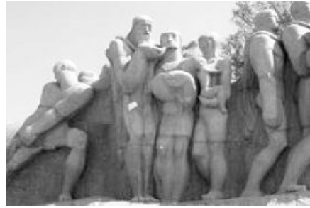
Victor Brecheret. Monumento às bandeiras . Parque Ibirapuera, São Paulo, Brasil, 1954.

A abordagem do Monumento às bandeiras , de Victor Brecheret, em uma perspectiva multiculturalista no ensino de artes, implica, prioritariamente,