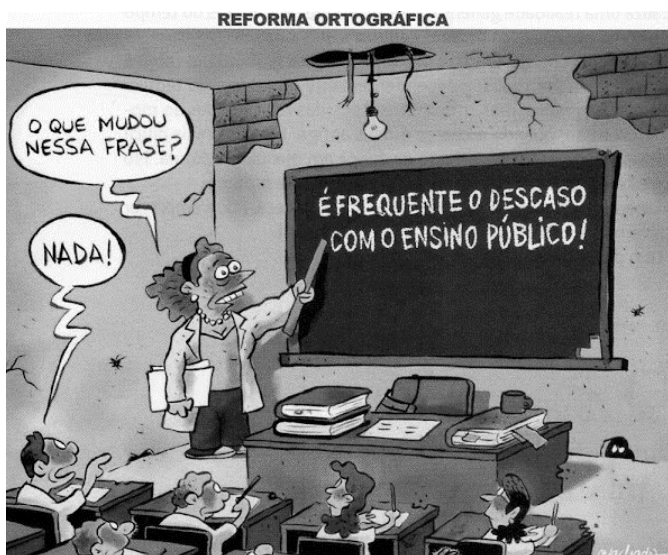
Renato Machado. Reforma ortográfica.

Internet: < https://www.portuguescompartilhado.blog.com.br/ >.