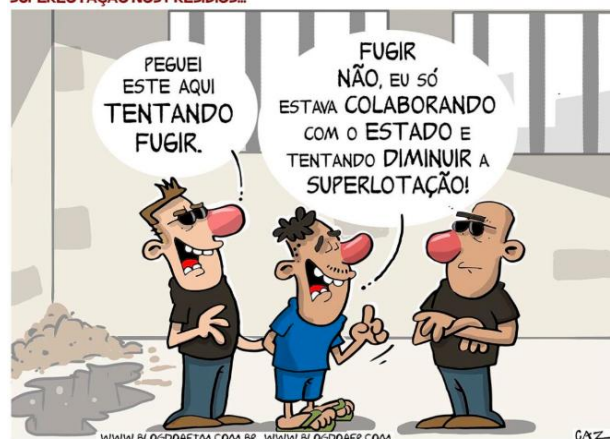
CAZO. Superlotação nos presídios . Disponível em < https://blogdoaftm.com.br/charge-superloacao-nos-presidios/ >.

A palavra “só”, utilizada pelo personagem na charge acima, possui o sentido de: