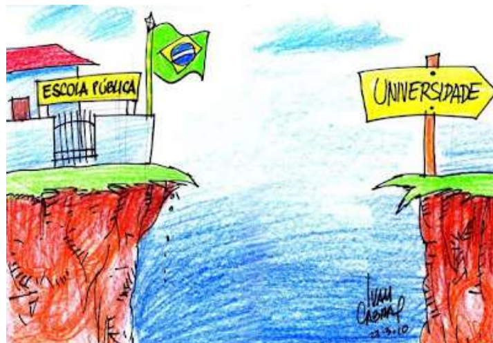
CABRAL, Ivan. Blog Sorriso Pensante: humor gráfico e derivados . Disponível em: https://www.ivancabral.com/ . Acesso em: 05 jan. 2026.

10. Na charge, a linguagem visual expressa o sentido crítico do texto por meio da figura de linguagem: