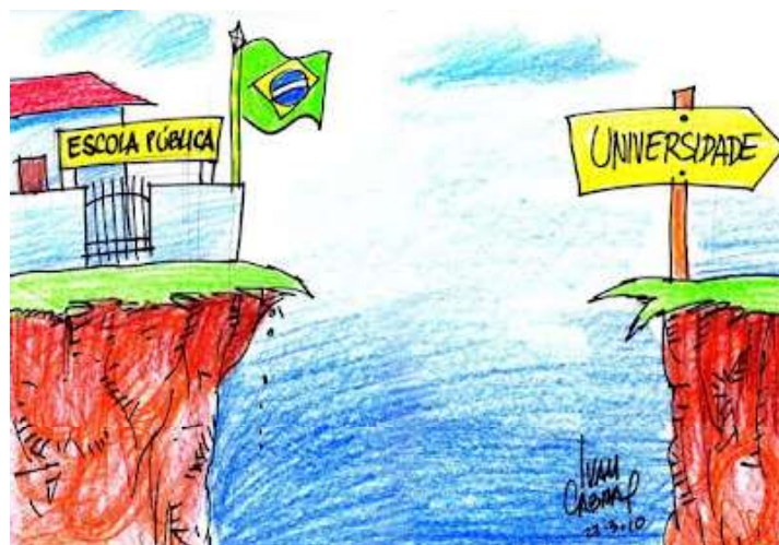
CABRAL, Ivan. Blog Sorriso Pensante: humor gráfico e derivados . Disponível em: https://www.ivancabral.com/ . Acesso em: 05 jan. 2026.

10. Na charge, a linguagem visual expressa o sentido crítico do texto por meio da figura de linguagem: