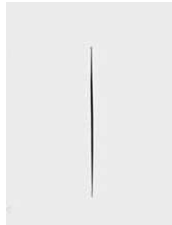
Concetto Spaziale/Attesa, do italiano Lucio Fontana, tela com uma incisão

Disponível em: Folha de S.Paulo - Isso é arte, você sabe dizer sabe por quê? (com foto) - 19/10/98. Acesso em: 3. fev. 2026.