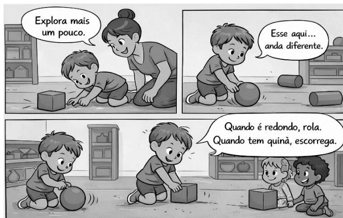
Imagem produzida por IA.

Considerando a tirinha, assinale a afirmativa que descreve corretamente os conceitos de assimilação e acomodação de acordo com Piaget.