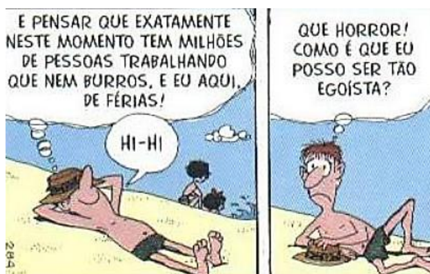
QUINO. Mafalda . Disponível em https://agendadasbugigangas.wordpress.com/wp-content/uploads/2011/05/mafalda-quino.pdf .