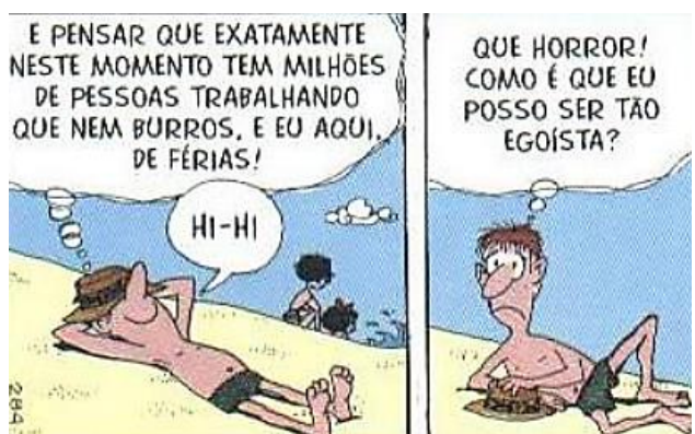
QUINO. Mafalda . Disponível em https://agendadasbugigangas.wordpress.com/wp-content/uploads/2011/05/mafalda-quino.pdf .