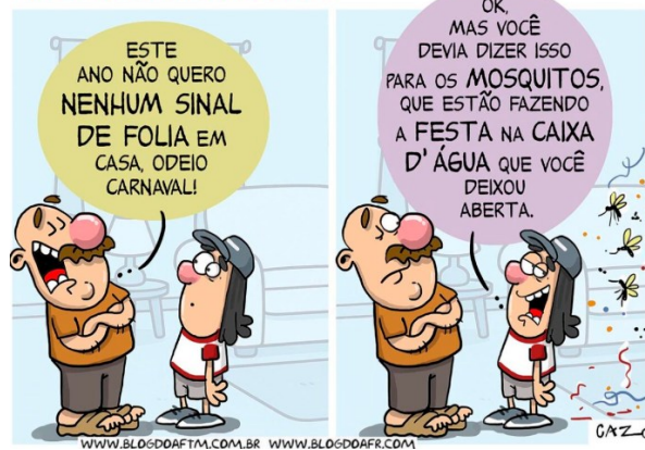
CAZO. Aumento no número de focos.

Na charge acima, a forma verbal “devia dizer” tem como verbo auxiliar uma forma no: