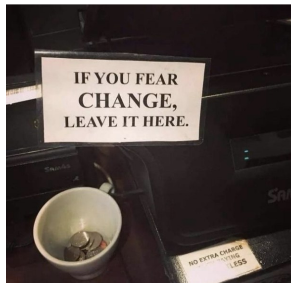
Instagram post. Available at: https://www.instagram.com/p/DFGuNOIMsUo/t .

In English, the word “change” may have more than one meaning. It can refer to a modification or transformation in a situation. The sign in the image reads: “IF YOU FEAR CHANGE, LEAVE IT HERE.”