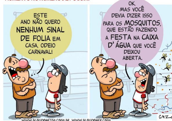
CAZO. Aumento no número de focos. Disponível em < https://blogdoaftm.com.br/charge-aumento-no-numero-de-focos/ >.

Na charge acima, a forma verbal “devia dizer” tem como verbo auxiliar uma forma no: