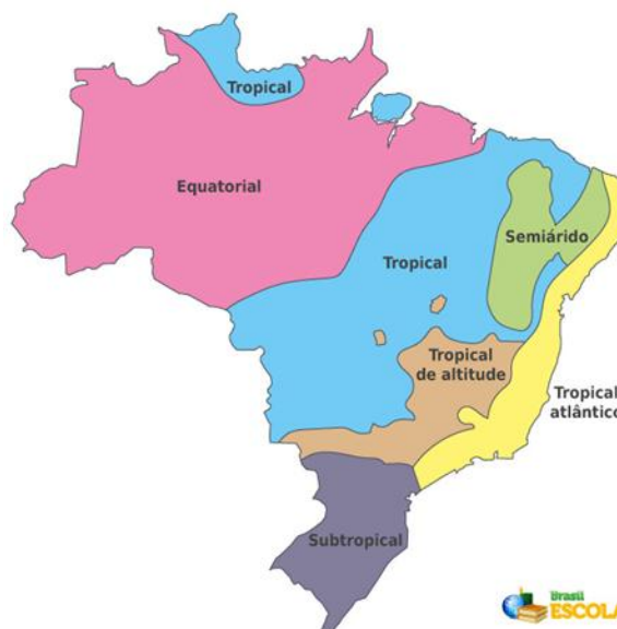
Mapa dos climas do Brasil