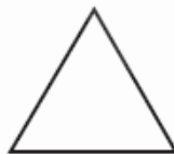
Figura 3 Sem escala.

QUESTÃO 45 – A Figura 3 abaixo apresenta um símbolo básico para projetos de segurança contra incêndio. Qual é a denominação desse símbolo?