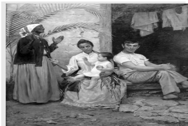
A Redenção de Cã (1895), de Modesto Brocos

A obra “A Redenção de Cã” (1895), de Modesto Brocos, articula, em sua tessitura imagética, um complexo jogo de significações que dialoga intertextualmente com a narrativa bíblica da maldição de Cã (Detalhes sobre a história bíblica da Maldição de Cã. Na história do Gênesis (7:21), Cã se apresenta como um dos três filhos de Noé, salvos do dilúvio por Javé. Segundo as escrituras, Cã viu Noé bêbado e nu em sua tenda e, em vez de cobri-lo, foi chamar os irmãos Sem e Jafé. Os irmãos ficaram constrangidos e cobriram o pai. Envergonhados, se mantiveram de costas para não verem sua nudez. Ao recobrar a sobriedade, Noé soube do ocorrido e amaldiçoou Cã e seus descendentes, determinando que fossem escravos.), ao mesmo tempo em que se insere no horizonte ideológico do cientificismo racial do século XIX.