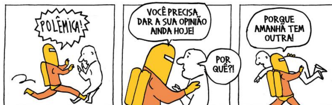
LAERTE. Polêmica! . São Paulo: Folha de S.Paulo, s.d. Tirinha.