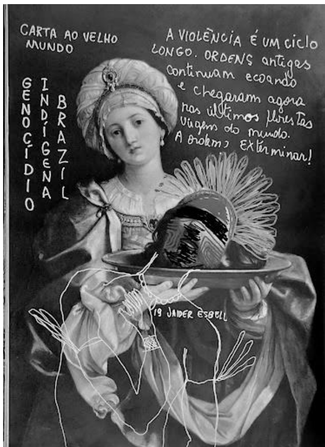
Carta ao velho mundo. Jaider Esbell. 2018/2019.

Considerando a seguinte obra do artista Jaider Esbell, assinale a alternativa que apresenta uma proposta de aula com base na discussão poética e política apontada pelo artista em sua obra.