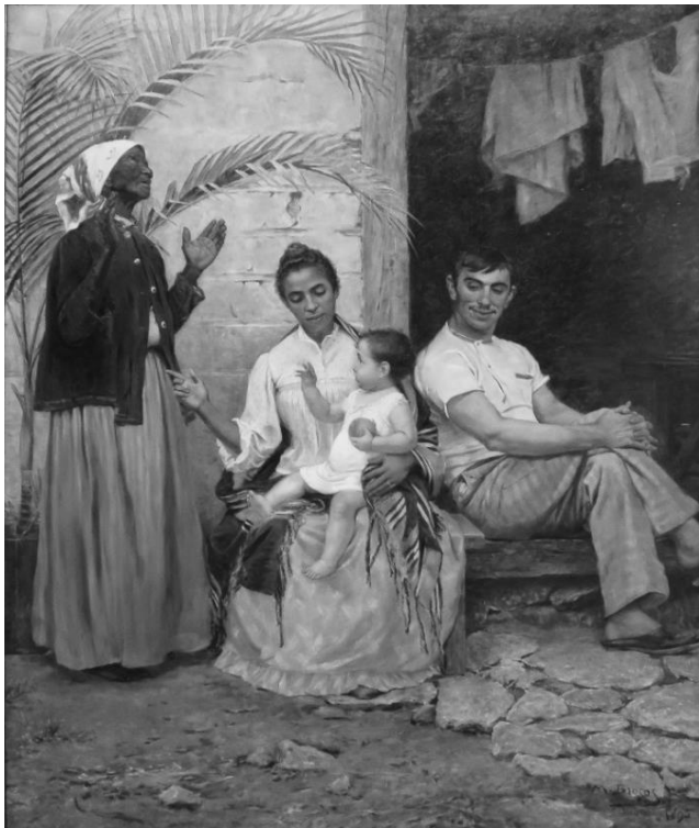
A Redenção de Cam. Modesto Brocos, 1895.

Uma professora de arte apresentou a obra Redenção de Cam para a turma do primeiro ano do ensino médio, para discutir sobre a pintura a partir de uma abordagem decolonial das artes.