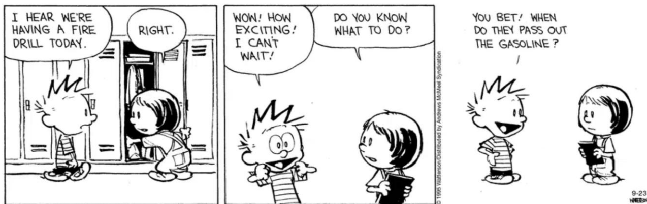
Available at: https://www.gocomics.com/calvinandhobbes/2025/09/23

In the comic strip, Calvin misunderstands the meaning of "fire drill." What is the humorous effect of his interpretation?