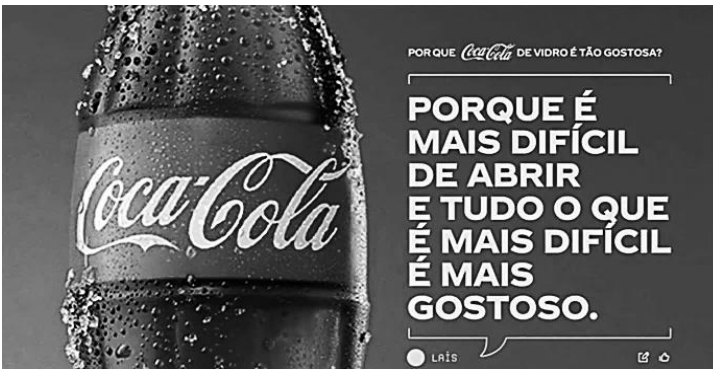
Coca-Cola, 2025. Publicidade veiculada em diferentes mídias.

A publicidade apresenta a imagem de uma garrafa de Coca-Cola de vidro acompanhada do texto: "Porque é mais difícil de abrir e tudo o que é mais difícil é mais gostoso." Considerando estratégias argumentativas típicas da linguagem publicitária, o anúncio