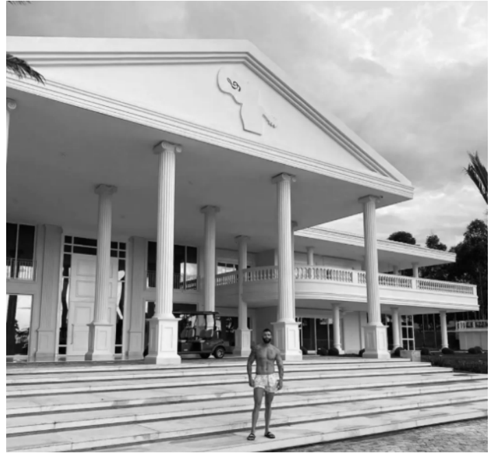
Imagem 1 - Casa do cantor Gustavo Lima.