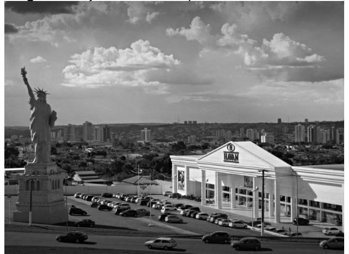
Imagem 2 - Loja Havan em Anápolis-GO.